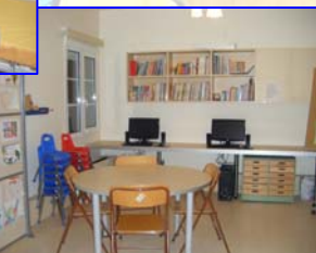
Σχολείο για τους μικρούς ασθενείς