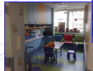
Χώροι για τα παιδιά και τους γονείς