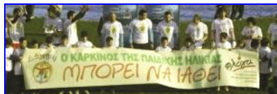
Super League ΟΠΑΠ

Για την πραγματοποίηση των σκοπών της, η Λάμψη δεν είναι μόνη της, έχει την συμπαράσταση του κόσμου, που εκφράζεται μέσα από διάφορες εκδηλώσεις όπως μουσικές, αθλητικές, πολιτιστικές, κοινωνικές, ημερίδες κ.α.