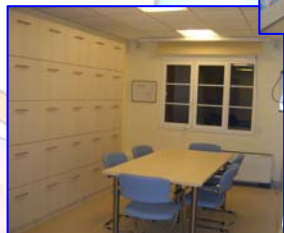
Αρχειό ιατρικών φακέλων