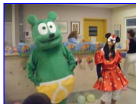
Εκδηλώσεις για τα παιδιά μέσα κι έξω από τα νοσοκομεία