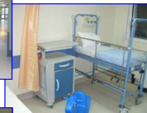
Ειδικές κλινές για τα μικρότερα παιδιά